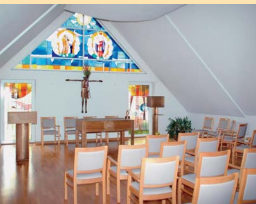
Andachtsraum im Kursana Domizil Ergolding