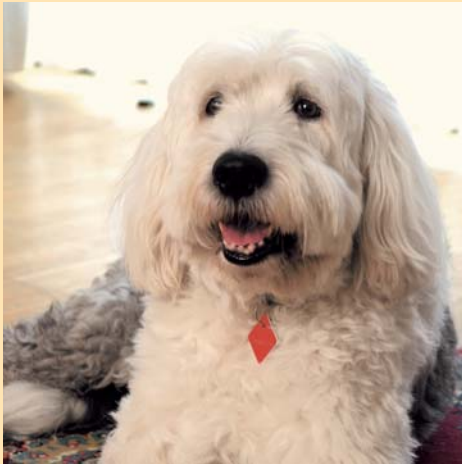
Zu unseren besonderen Therapien gehört u.a. ein Therapiehund.