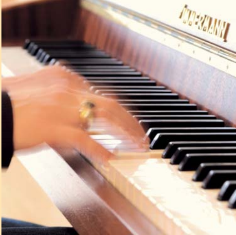
Unser bunter Veranstaltungskalender.