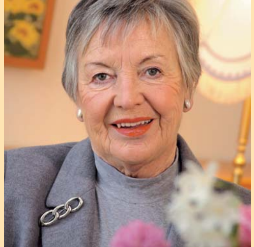
Wohnen in netter Gesellschaft.