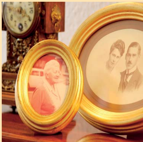
Ihre persönliche Einrichtung.