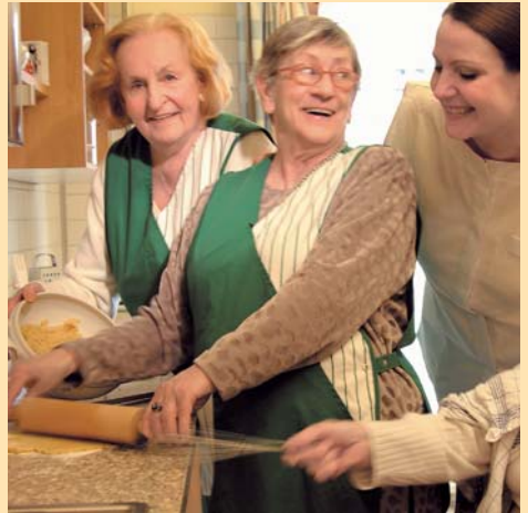
Kreativ bleiben, zum Beispiel mit Kursangeboten wie Backen.

spezielles Koordinations- oder Wahrnehmungstraining in Anspruch nehmen. Nicht zu vergessen, was wir auch sonst für Ihre geistige und körperliche Fitness tun können. Unser Kursangebot reicht von der Malerei über Yoga bis hin zum